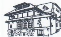
MUZEUL NAȚIONAL BRĂȚIANU