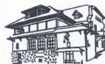
MUZEUL NAȚIONAL BRĂTIANU