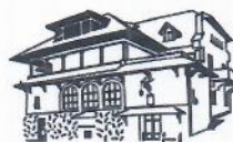
MUZEUL NAȚIONAL BRĂȚIANU

Ștefănești, Argeș, Strada Ion I. C. Brătianu, nr. 37 CIF 42232014, Cod poștal 117715 Tel. 0787.410.825 / 0248.707.417 e-mail: muzeulbratianu@gmail.com