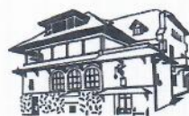
MUZEUL NAȚIONAL BRĂTIANU