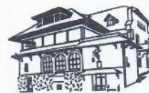
MUZEUL NAȚIONAL BRĂȚIANU

Ștefănești, Argeș, Strada Ion I. C. Brătianu, nr. 37 CIF 42232014, Cod poștal 117715 Tel. 0787.410.825 / 0248.707.417 e-mail: muzeulbratianu@gmail.com