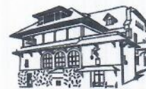
MUZEUL NAȚIONAL BRĂȚIANU