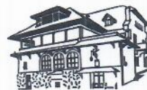
MUZEUL NAȚIONAL BRĂȚIANU