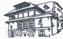
Muzeul Național Brătianu

Ștefănești, Argeș, Strada Ion I. C. Brătianu, nr. 37 CIF 42232014, Cod poștal 117715 Tel. 0787.410.825 / 0248.707.417 e-mail: muzeulbratianu@gmail.com