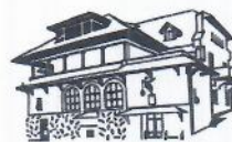
MUZEUL NAȚIONAL BRĂȚIANU

Ștefănești, Argeș, Strada Ion I. C. Brătianu, nr. 37 CIF 42232014, Cod poștal 117715 Tel. 0787.410.825 / 0248.707.417 e-mail: muzeulbratianu@gmail.com