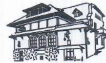
MUZEUL NAȚIONAL BRĂȚIANU