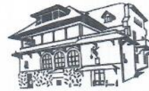
MUZEUL NAȚIONAL BRĂȚIANU

Ștefănești, Argeș, Strada Ion I. C. Brătianu, nr. 37 CIF 42232014, Cod poștal 117715 Tel. 0787.410.825 / 0248.707.417 e-mail: muzeulbratianu@gmail.com