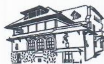
MUZEUL NAȚIONAL BRĂȚIANU

Ștefănești, Argeș, Strada Ion I. C. Brătianu, nr. 37 CIF 42232014, Cod poștal 117715 Tel. 0787.410.825 / 0248.707.417 e-mail: muzeulbratianu@gmail.com