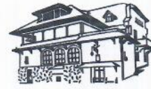
MUZEUL NAȚIONAL BRĂȚIANU

Ștefănești, Argeș, Strada Ion I. C. Brătianu, nr. 37 CIF 42232014, Cod poștal 117715 Tel. 0787.410.825 / 0248.707.417 e-mail: muzeulbratianu@gmail.com